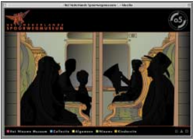
Nederlands Spoorwegmuseum: mooie animaties