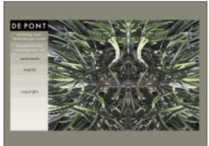
De Pont: goede afbeeldingen

tonen. In beide gevallen gaan musea ervan uit dat hun site per definitie een onderdeel van hun activiteiten is, namelijk om basis- en educatieve informatie aan publiek, personen en onderwijs te verstrekken... Op dit moment geven museum sites daarom weinig meerwaarde aan de getoonde objecten in vergelijking met de kijk- en leerervaring in traditionele museumruimtes. In plaats van informatieinterpretatie beperken musea zich op het net tot informatieverstrekking.'