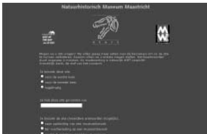
Natuurhistorisch Museum Maastricht: gebruikersenquête op de 'splash screen'

Ook in deze test hebben we de vraag naar webtoegankelijkheid voor visueel of anderszins gehandicapten opgenomen. 7 En helaas hebben we ook nu weer moeten constateren dat het hiermee onder de door ons geteste sites slecht gesteld is. Bij de controle van de sites met behulp van Bobby 8 blijkt dat vijf sites een 'ja, mits' hebben op level 1. Het is dan nog de vraag of de site ook echt toegankelijk is. Zo kreeg Museum Boijmans van Beuningen