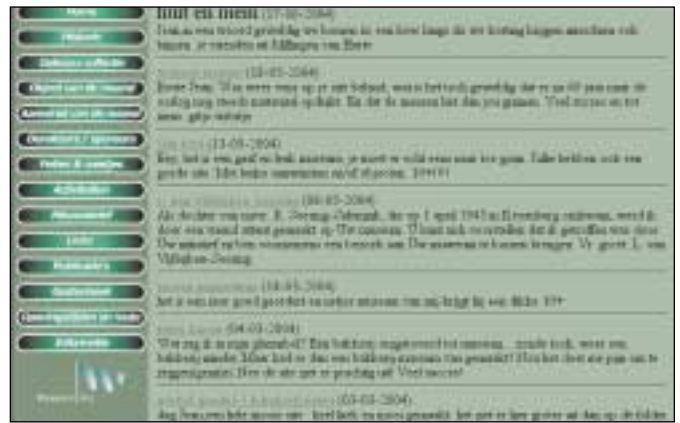
Achterhoeks Museum 1940-1945: een uitgebreid gastenboek met veel hartverwarmende boodschappen

In totaal hebben twaalf musea een nieuwsbrief op de website. 14 Hiervan bieden zeven de mogelijkheid om je via e-mail of een webformulier hierop te abonneren. Teylers Museum laat je als potentiële nieuwsbrieflezers lelijk zoeken, aangezien de nieuwsbrief zelf niet op de website staat,